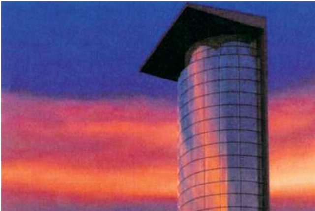
La tour de 33 étages proposée pour le quartier d'Estimauville Centre Jardin Hamel

Dans l'article sur la revitalisation du quartier d'Estimauville, le point qui a retenu mon attention, c'est bien sûr la tour de 33 étages au bord du fleuve. Sur la photo de la maquette, aucun voilier n'apparaît, aucun bateau, ni kayak. Comme si le lien avec le fleuve était juste du haut d'une tour de 33 étages! Est-ce que notre projet de vouloir redonner le fleuve pour les usages reliés à l'eau n'est pas assez fou?