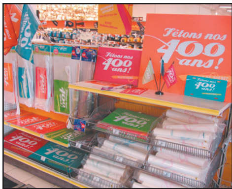
Les produits du 400e sont bien en vue à l'entrée des magasins Canadian Tire de la région dont celui du boulevard Hamel.

Les produits proposés affichent tous le slogan «Fêtons nos 400 ans!», lancé il y a quelques semaines en réponse aux critiques déplorant de manque de clarté de l'affichage du 400e. Au dire des organisateurs, ils ont