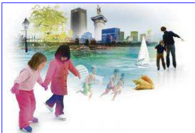
Illustration : Philippe Tardif

«Plonger dans le fleuve, marcher dans la rue» (à propos d'un projet de plage en plein Vieux-Montréal, projet proposé par Léonce Naud et qui est arrivé premier dans le sondage de Cyberpresse sur ce que veulent les montréalais, devant la fermeture de la rue Sainte-Catherine aux automobiles), La Presse, Agnès Gruda, 19 septembre 2009.