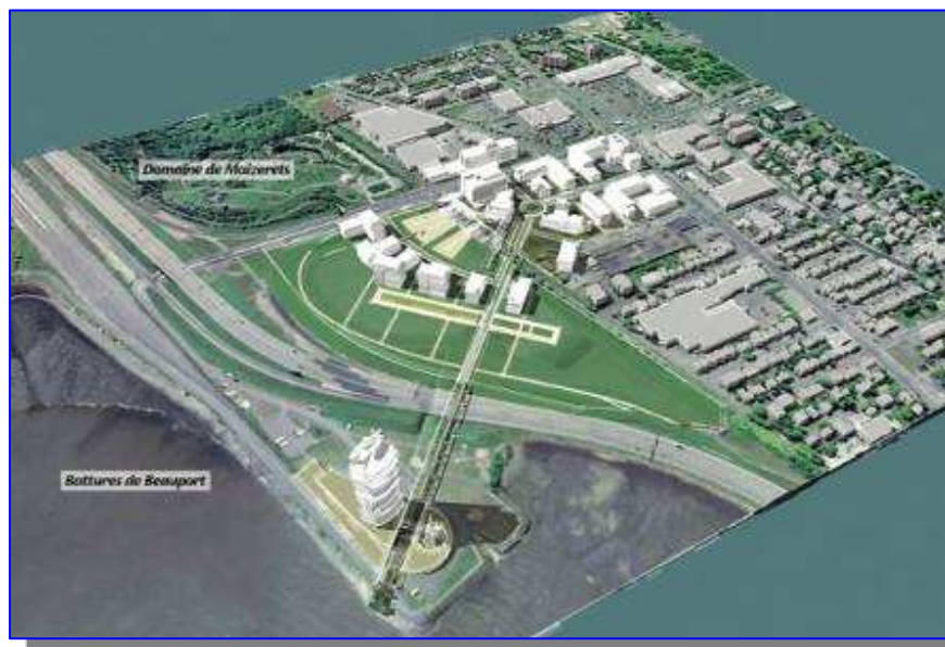
Maquette : Ville de Québec

« Deux nouveaux quartiers verts pour Québec » (l'administration Labeaume propose de construire deux éco-quartiers de 3300 logements dans les secteurs d'Estimauville et Pointe-aux-Lièvres. Question de marquer l'importance de ce nouveau secteur, Québec souhaite y voir apparaître en bordure du fleuve une tour de 33 étages, ce qui en ferait le plus haut bâtiment de la capitale), Pierre-André Normandeau, 28 septembre 2009.