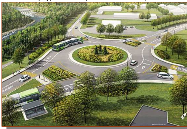
Illustration : Benoît Gauthier

■ «Voies Métrobus 803 : réservées en tout temps» (les futures voies sur le boulevard Lebourgneuf où circuleront les Métrobus 803 à compter de l'an prochain seront réservées 24 heures sur 24, sept jours sur sept), Le Soleil, Pierre Pelchat, 12 avril 2010.