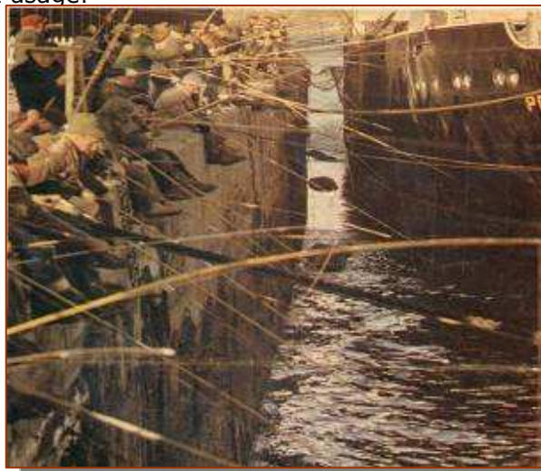
(Photo de 1961 à Québec, supplément Perspectives du journal Le Soleil )