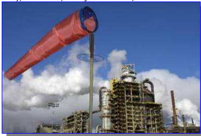
Usine pétrochimique, Alberta

«GES : Ottawa envisage des cibles plus faibles pour le secteur pétrolier» (selon des documents obtenus par CBC le gouvernement Harper a envisagé de réduire considérablement l'effort demandé dans son plan Prendre le virage, de 48 mégatonnes par année à 15 mégatonnes), La Presse, François Cardinal, 15 décembre 2009.