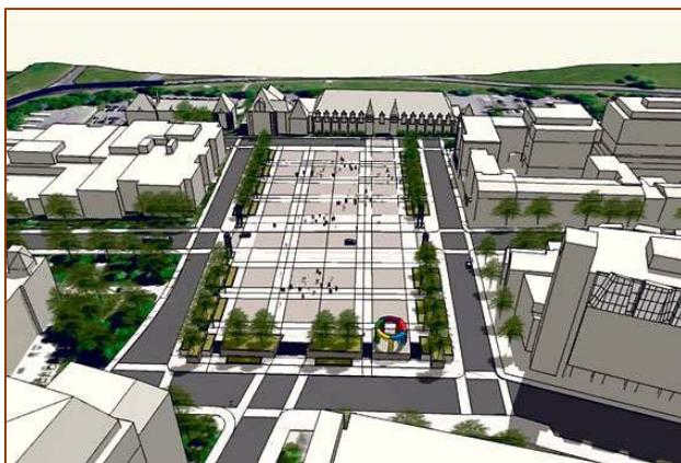
(Illustration Ville de Québec)

un îlot de chaleur), Le Soleil, Marc Allard, 10 juin 2010.