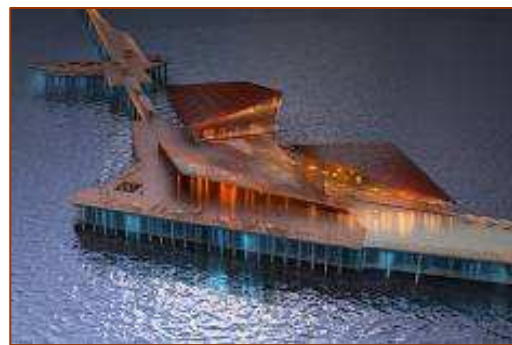
(Southend Pier, Royaume-Unis)