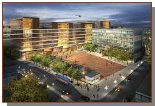
(Hôpital de New Karolinska, Suède)

■ «Des Suédois planifient l'aménagement de d'Estimauville» (la firme suédoise White Arkitekter, quatrième plus important cabinet d'Europe, a réalisé les plans de l'hôpital universitaire New Karolinska et a gagné un concours international en 2007 pour le Southend Pier, ce quai baignant dans la Manche), Le Soleil, Pierre-André Normandin, 18 mai 2010.