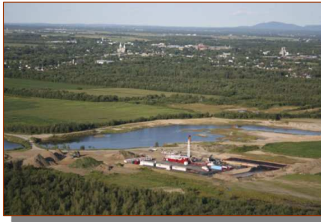
Sur la photo : Exploration de gaz de schiste à Farnham, en 2009, par Canbriam Energy