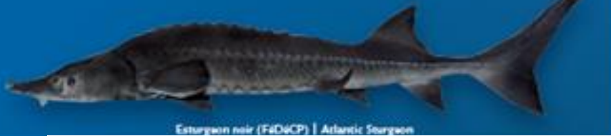
Esturgeon noir (F&D&CP) | Atlantic Sturgeon